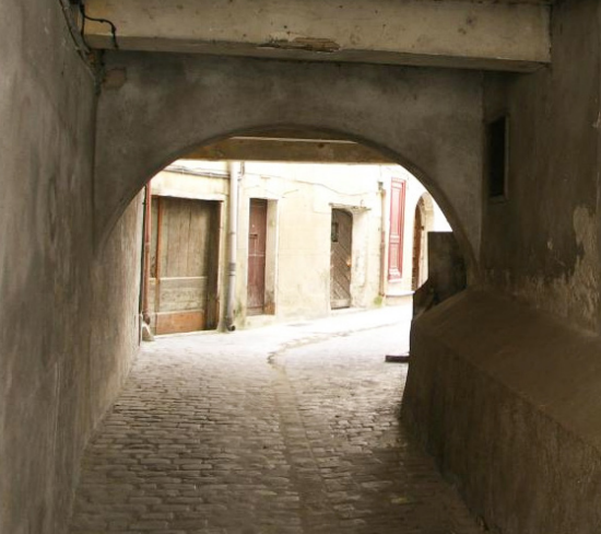
Impasse du mas Saint-Jean