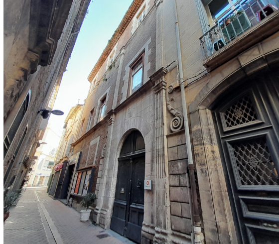
Hôtel de Camprodon, rue du Théâtre