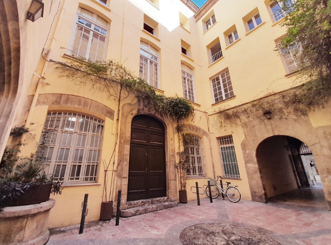
Ancien Conseil Souverain (palais de la Députation)