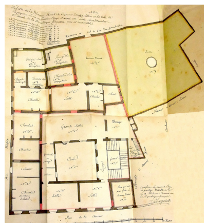
Plan révolutionnaire, hôtel de Copons (Hôtel Pams) – ADPO