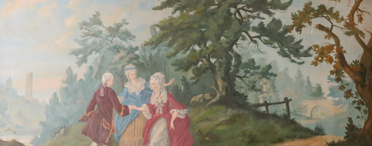
Décor mural, hôtel Delpas (Musée d'art Hyacinthe Rigaud)

Les glaces encadrées de bois doré , placées au-dessus des cheminées, sont, plus que les autres meubles, l'expression du luxe et de l'élégance, par leurs décors souvent très raffinés.