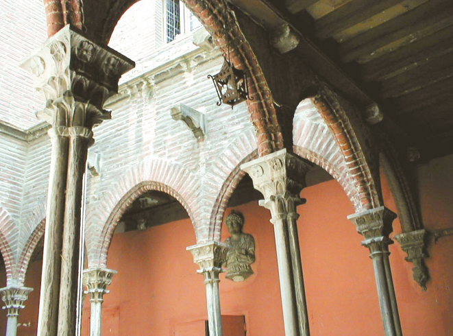
Galerie intérieure (hôtel de Sant Martí) avant restauration, rue des Fabriques d'en Nabot