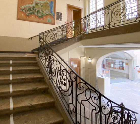
Hôtel de Çagarriga (Muséum d'histoire naturelle)