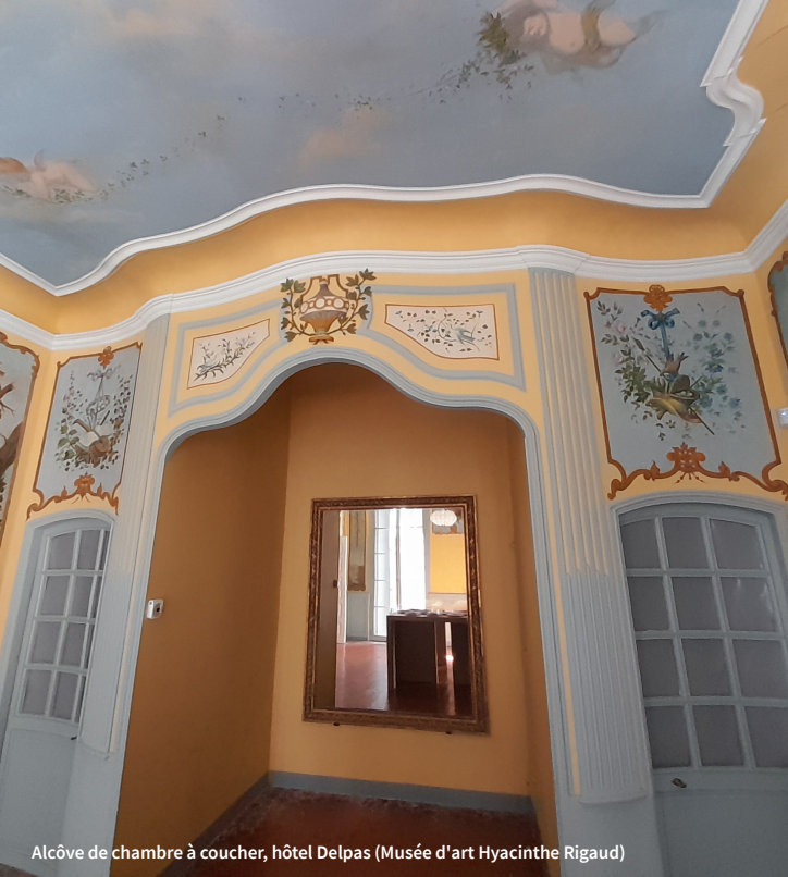
Alcôve de chambre à coucher, hôtel Delpas (Musée d'art Hyacinthe Rigaud)