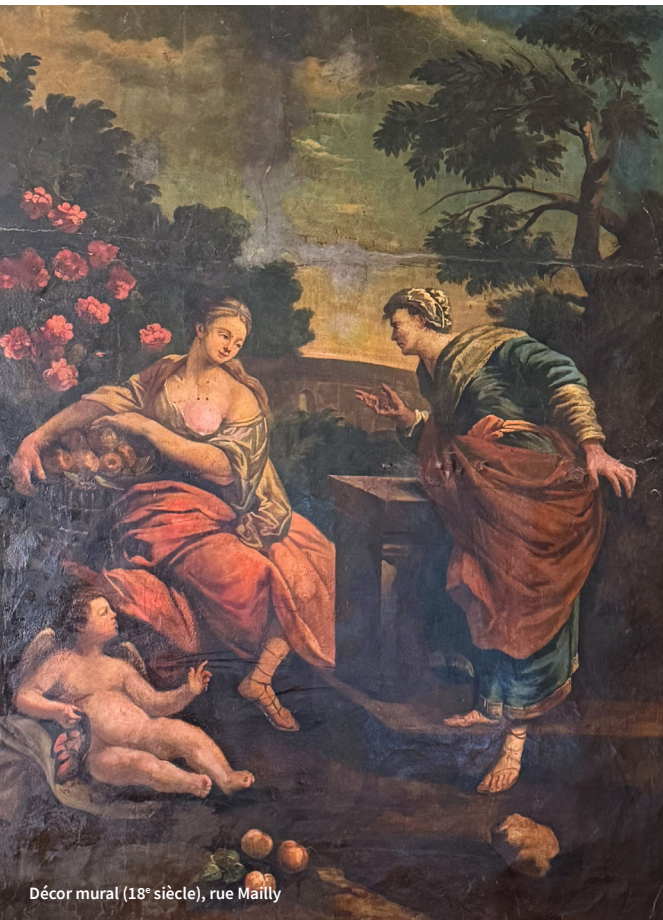
Décor mural (18 e siècle), rue Maillé