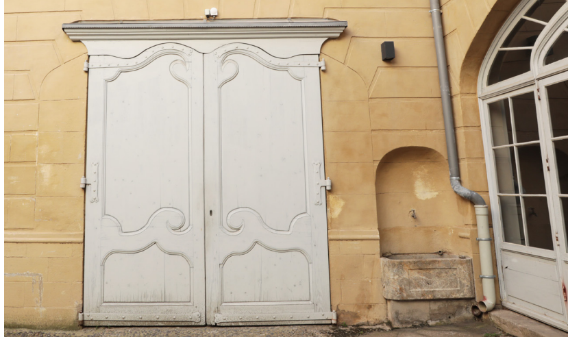
Porte d'écurie, hôtel Delpas (Musée d'art Hyacinthe Rigaud)