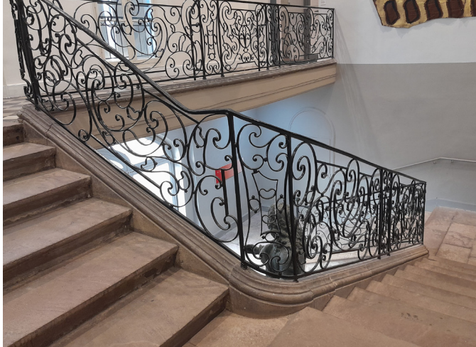
Hôtel Delpas (Musée d'art Hyacinthe Rigaud)

Ce n'est que sous la Régence, dans les années 1730-1740, que le goût français fait son apparition et s'installe durablement.