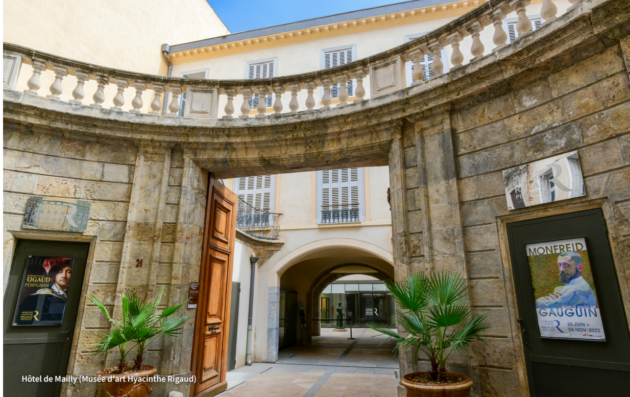
Hôtel de Mailly (Musée d'art Hyacinthe Rigaud)