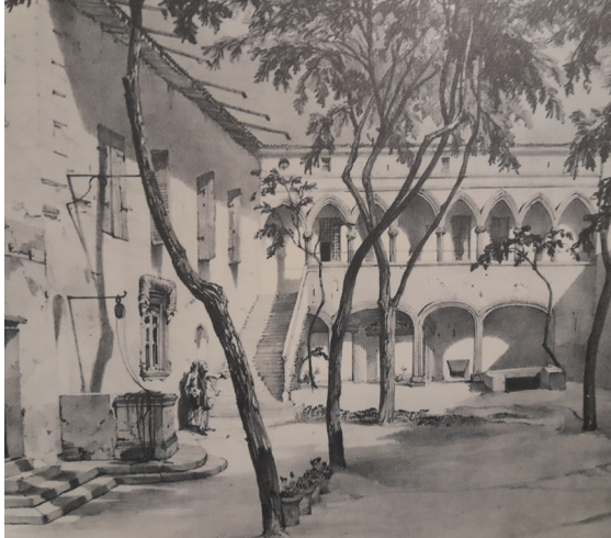
Cour intérieure (hôtel de Llupià - Oms/Casa Xanxo) avant transformation, rue de la Main de Fer

Ce n'est qu'au 15 e siècle que Perpignan devient une ville aristocratique, lorsque les familles seigneuriales se mêlent aux élites marchandes et acquièrent des habitudes de luxe et de vie urbaine. Les nobles rachètent les petites maisons d'artisans et les rassemblent. Les anciennes impasses deviennent des cours intérieures. Ainsi, les anciens mas disparaissent pour laisser la place aux premiers grands hôtels particuliers .