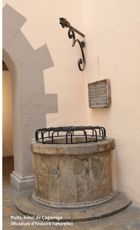
Puits, hôtel de Çagarriga (Muséum d'histoire naturelle)