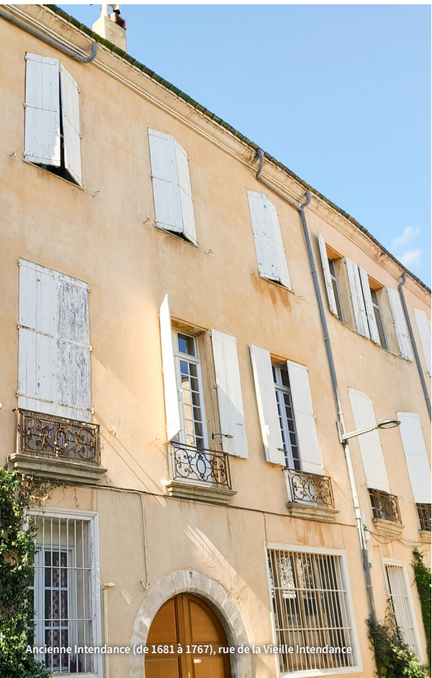
Ancienne Intendance (de 1681 à 1767), rue de la Vieille Intendance