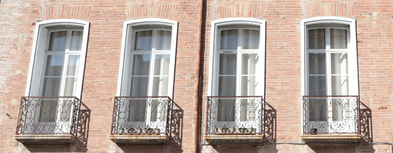
Hôtel de Noailles, place Gambetta