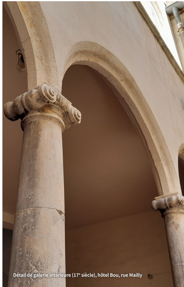
Détail de galerie intérieure (17 e siècle), hôtel Bou, rue Mailly