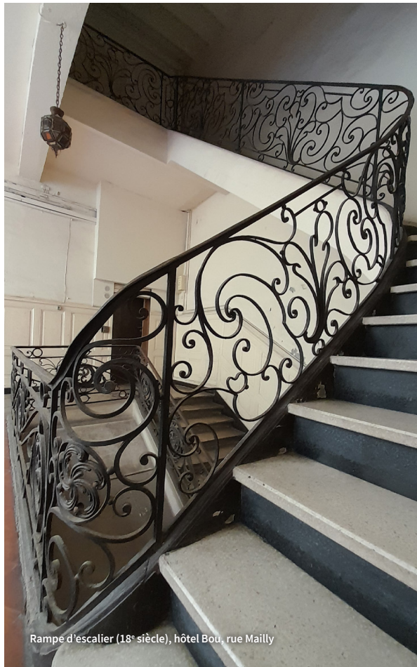
Rampe d'escalier (18 e siècle), hôtel Bou, rue Mailly