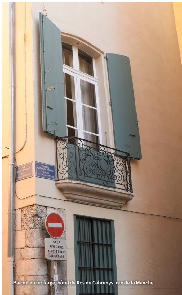
Balcon en fer forgé, hôtel de Ros de Cabrenys, rue de la Manche