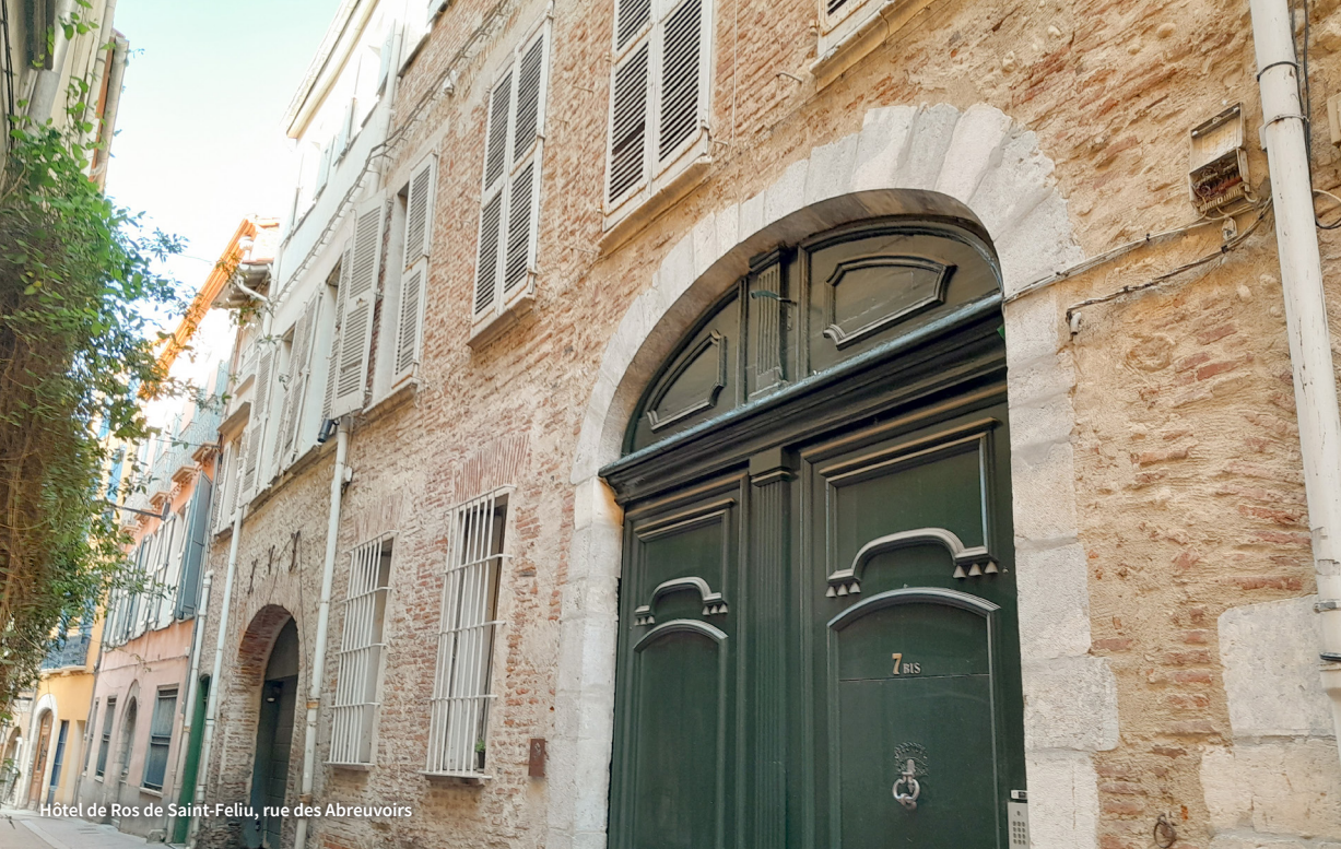
Hôtel de Ros de Saint-Feliu, rue des Abrevoirs